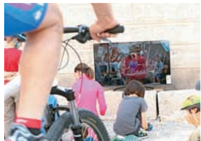
Filmska matineja na kolesarski pogon