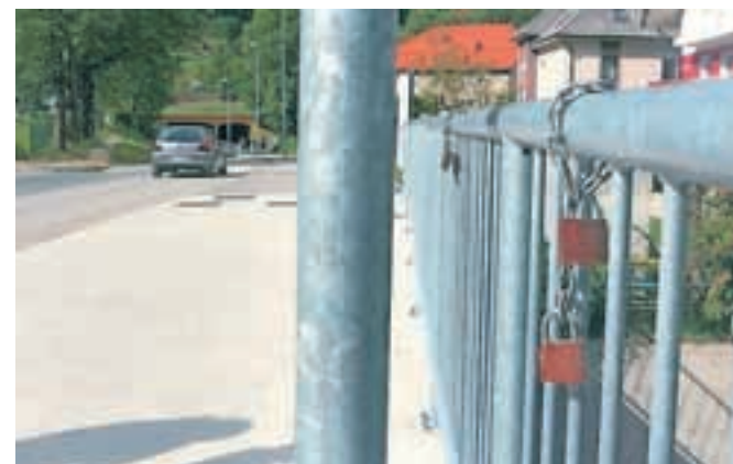
Po zgledu rimskega mostu Ponte Moccia in ljubljanskega Mesarskega mostu ter številnih drugih mostov ljubezni se ključavnice ljubezni pojavljajo tudi na mostu čez Savo Dolinko.

Na mostu čez Savo Dolinko pri dvorani Podmežakla so priključene že štiri ključavnice, njihovo število pa bo zagotovo še naraslo. Tako tudi Jesenice po ljubljanskem Mesarskem mostu, ki je ena zadnjih tovrstnih lokacij, dobivajo svoj most ljubezni. Od kje ideja za most in ključavnice ljubezni ni znano, fenomen pa si lastijo Italijani s filmom, posnetim po romanu Želim si te, v katerem zaljubljenca ključavnico s svojima imenoma prikleneta na ulično svetilko na rimskem mostu Ponte Milvio in ključ vržeta v reko Tiberio.