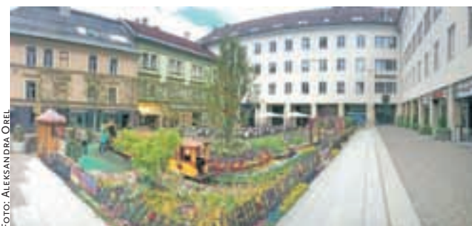
Pogled na glavni mestni trg in Mestno hišo v Beljaku