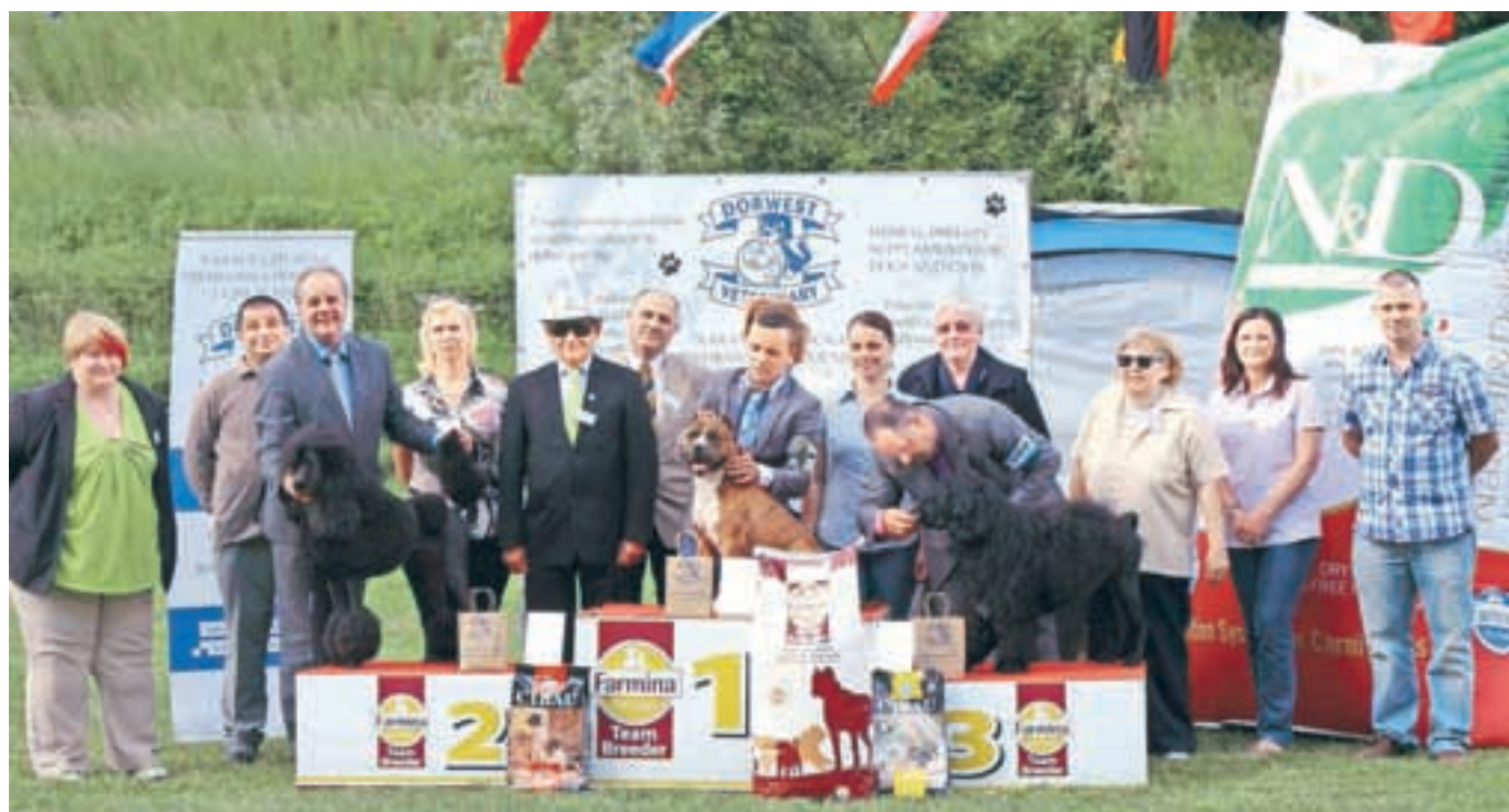
Zmagovalec je postal ameriški staffordski terier AJ Artillery's Party Boy.

psom Sweet Obsession Buick Roadmaster. Ob razstavi je potekalo tudi zbiranje pomoči, predvsem hrane za pse v poplavljenih krajih Bosne in Hercegovine, Hrvaške in Srbije. Skupno so na razstavi zbrali kar tri tone različne pasje hrane, ki so jo predali prostovoljcem, ki v prizadete kraje odvažajo pomoč. Kot je še dodala Renata Bok, se zahvaljujejo vsem donatorjem, prostovoljcem in dijakom jeseniške Gimnazije, ki so pomagali pri pripravi razstave.