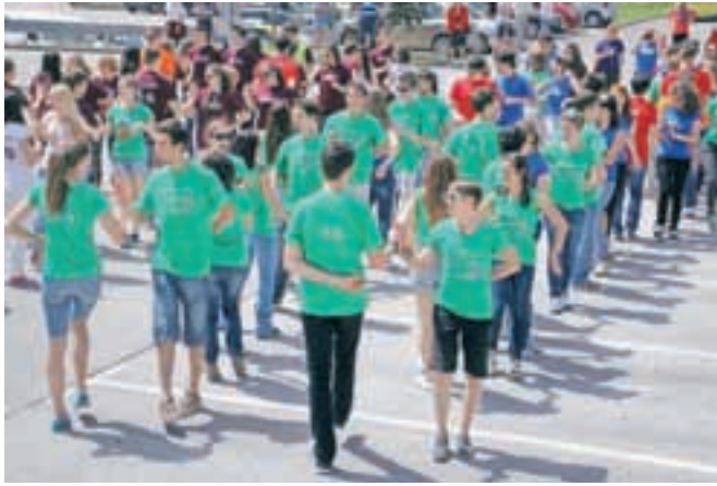
... nato pa so veselo in sproščeno zaplesali letošnjo četvorko.