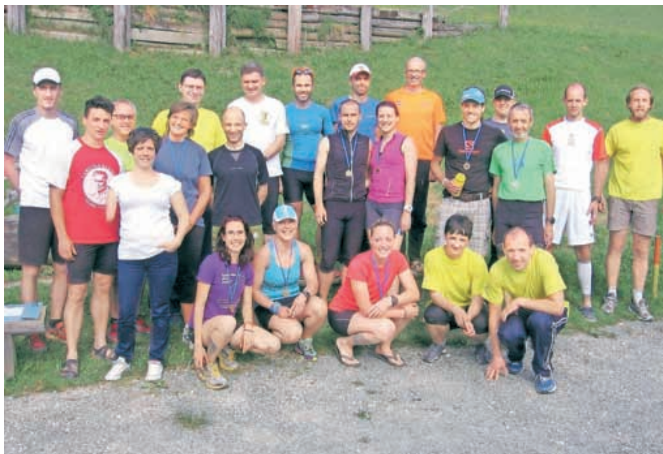
Udeleženci prve prireditve 6 ur Španovega vrha