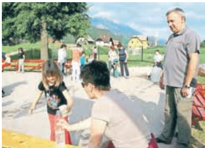
Otroci iz vrtcev ter njihovi starši so se preizkusili v različnih spretnostih.