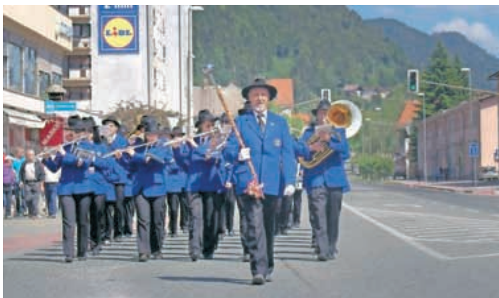
Pihalni orkestri na Cesti maršala Tita