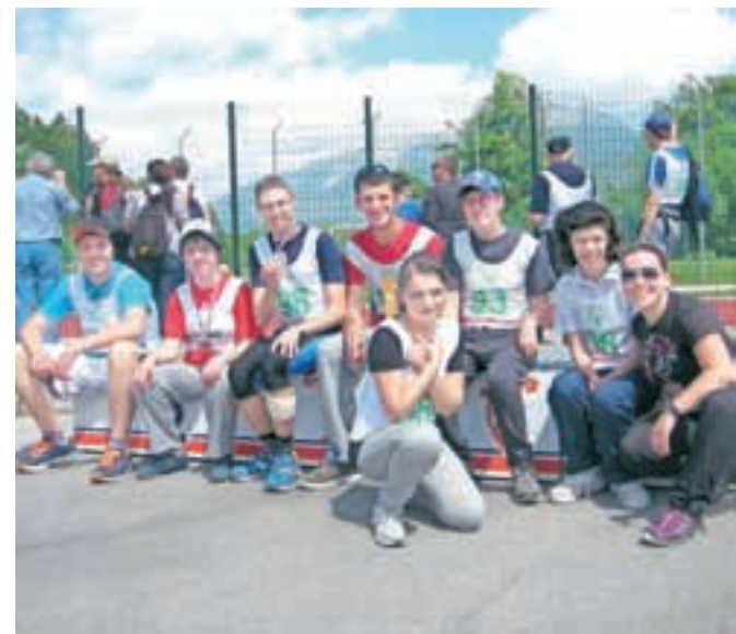
Utrujena, a zadovoljna ekipa OŠ Poldeta Stražišarja