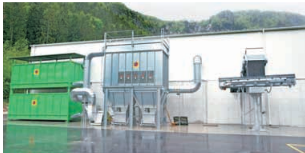
Sodobna tehnološka linija za obdelavo komunalnih odpadkov je postavljena ter pripravljena na poskusni zagon.

Tako bo na Mali Mežakli v dveh letih urejen center za celovit sistem ravnanja s komunalnimi odpadki. Aktivnosti sledijo načrtom države iz Operativnega programa ravnanja s komunalnimi odpadki, ki ga je Vlada RS sprejela marca 2013, ki v delu, ki določa infrastrukturo za obdelavo odpadkov, določa tak objekt tudi na Mali Mežakli. Po programu naj bi bila omogočena obdelava odpadkov iz občin v enem od najbližjih primerenih objektov znotraj obstoječe oziroma načrtovane mreže naprav v Sloveniji. Center na Mali Mežakli bo zagotavljal ekonomsko in okolju najbolj sprejemljivo rešitev ravnanja s komunalnimi odpadki na Gorenjskem. Pri načrtovanju objekta je bila – v skladu s državnim operativnim programom – upoštevana vključitev vsaj vseh gorenjskih občin, ki bodo tako dolgoročno in celovito rešile vprašanje ravnanja s komunalnimi odpadki.