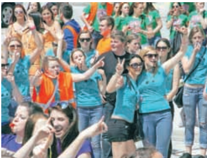
Živahno razpoloženi so maturanti prišli na parkirišče za občinsko stavbo.