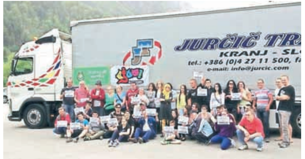
Prostovoljci iniciative Ejga – za lepše Jesenice ob priklopniku za Srbijo