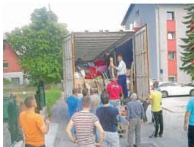
Nalaganje na tovornjak s pomočjo islamske skupnosti Jesenice

Nekateri občinski svetniki so namenili majsko sejnino za pomoč prizadetim v poplavah v občini Sanski Most v Bosni in Hercegovini in občini Valjevo v Srbiji, s katerima ima Občina Jesenice prijateljske stike. Z zbranim denarjem bodo kupili najbolj potreben material in ga v sodelovanju z občinsko civilno zaščito odpeljali v obe občini.