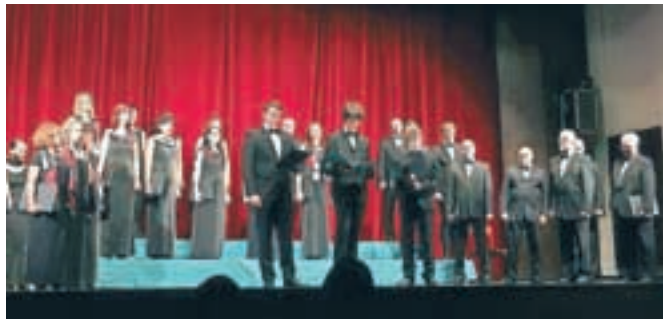
Zbori Vox Carniola so v kulturnem domu na Slovenskem Javorniku pripravili letni koncert.

Drozg. Kulturno društvo Vox Carniola in mešani pevski zbor delujeta že 16 let, v tem obdobju pa so sodelovali na domačih in tujih festivalih, jeseni leta 2013 prejeli zlato priznanje na regijskem tekmovanju pevskih zborov na Gorenjskem, na festivalu Naša pesem 2014 pa sta obe zasedbi Kulturnega društva osvojili srebrni plaketi. Kot je dejal eden izmed obiskovalcev, upa, da glasbeniki nad obiskom ne bodo preveč razočarani. "Še enkrat pa je to dokaz, da Jeseničani številnih dogodkov ne cenijo," je dodal.