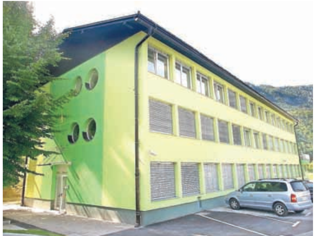
Visoka šola za zdravstveno nego Jesenice lahko postane fakulteta, sklep o tem so sprejeli jeseniški občinski svetniki.

Občinski svetniki so na mizo dobili tudi predlog odloka o občinskem podro-