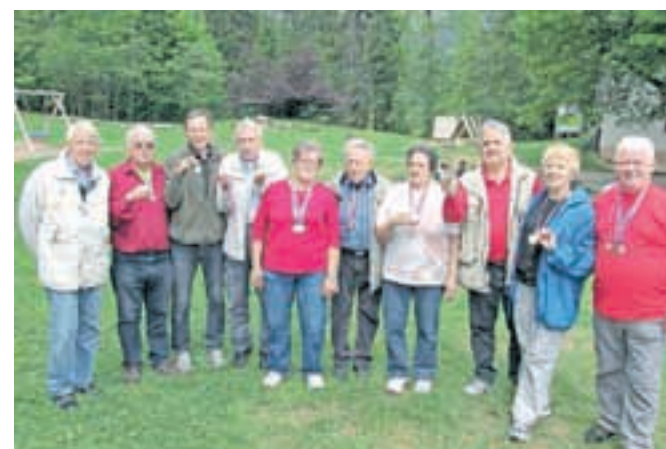
Jeseniški upokojenci z medaljami in prehodnim pokalom

stavi v Javorniškem Rovtu so najbolj uspešnim podelili kolajne in pokale. Prvo mesto in prehodni pokal je s 318 točkami osvojilo Društvo upokojencev Jesenice. Športniki so v posameznih disciplinah osvojili 15 kolajn. Na drugo mesto se je uvrstilo Društvo upokojencev Javornik-Koroška Bela z 264 točkami, posamezniki pa so osvojili 12 kolajn.